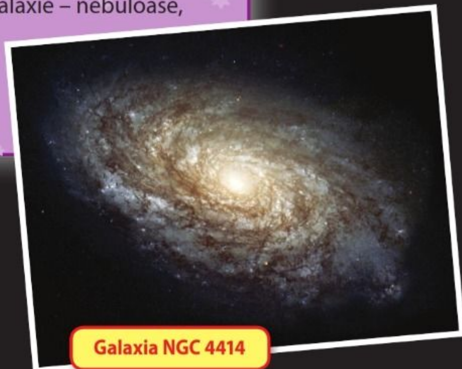
Galaxia NGC 4414

Tot ce se găsește într-o galaxie – nebuloase, stele, planete , praf și gaz – este ținut la un loc de gravitație.